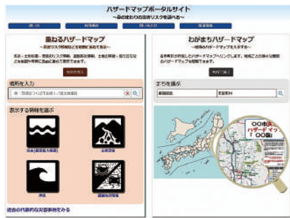
「ハザードマップポータルサイト」

置を示すことが望ましい」「対象物件が浸水想定区域に該当しないことをもって、水害リスクがないと相手方が誤認することのないよう配慮すること」等を追加しています。