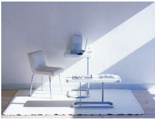
このほかにも、場所に縛られずに地方を活用する働き方を提案し、どこでも働ける環境を整えるプラットフォーム構想を立ち上げる事業が、(株)LIFULLによってスタートしています。

このようにテレワークの広がりを受けて、住宅・設備メーカーから在宅勤務向けの賃貸物件や