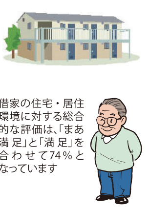
住生活総合調査によると「満足」は74%、「不満」は26%。借家に対する評価は「満足」は74%、「不満」は26%。環境的な満足度は低い。

借家の住宅に対する評価に関しては、不満率は昭和63年以降減少しており、昭和63年の約64%から平成30年に約33%となつて