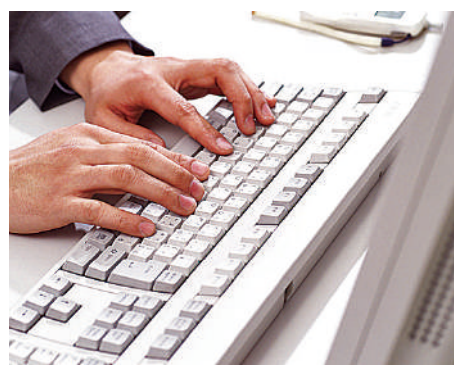
IT重説はもとより書面の電子化が、コロナ禍の影響を受けて運用に弾みがかかっています

のか、今後の動きを見ないと分かりませんが、テレワークの動向は常にチェックしておく必要があります。 IT重説はもとより書面の電子化が、コロナ禍の影響を受けて運用に弾みがかかっています