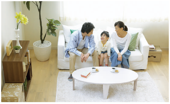
今後5年以内の住み替え意向では、借家から借家がおよそ4割を占めています

国土交通省から5年周期で実施している「平成30年住生活総合調査」(確報)がこのほど公表されました。住宅及び居住環境に対する評価や、今後の住まい方の意向などが明らかになっています。