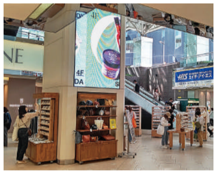
諸物価高騰や経費上昇の影響が懸念されています

国土交通省が公表した2025年の11月と第3四半期の「不動産価格指数」によると、住宅総合は前月比0・7%増の147・3、商業用不動産総合は前期比で1・1%増の147・2となりました。 第3四半期の商業用不動産のうち、店舗が同3・4%増の169・5、オフィスが同5・9%減の168・5、マンション・アパート(一棟)が同0・7%増の173・7となつています(2010年の平均を100として算出)。