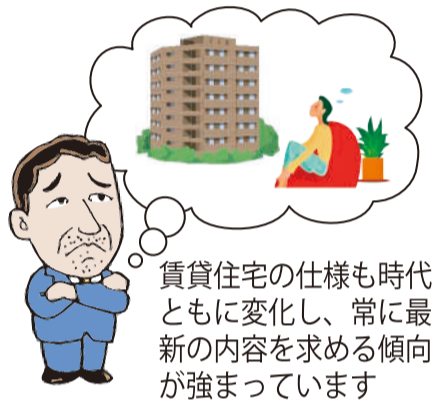
賃貸住宅の仕様も時代とともに変化し、常に最新の内容を求める傾向が強まっています

新築賃貸物件の設計担当者が「燃費のいい賃貸住宅」の性能を分かりやすく紹介。実際の物件で撮影することで、暮らしの中で感じられる快適性や光熱費削減といったメリットをよりイメージしやすくなっています。物件を探す若年層にも役立つ、住まい選びの新しい視点を提供する内容です。