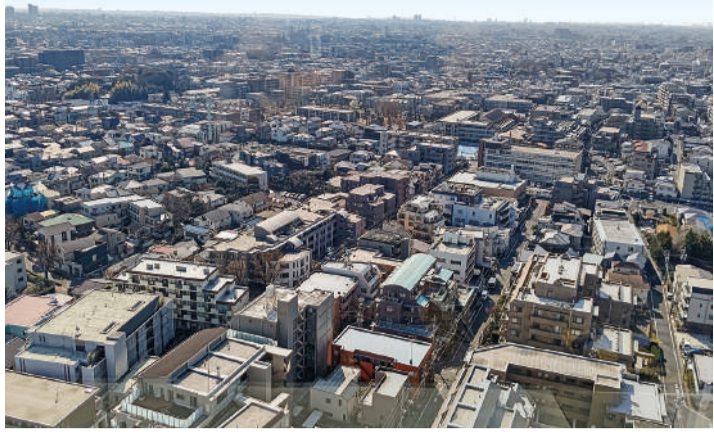
賃貸市場の多様性、住宅の性能アップは着実に広がりを見せています

賃貸住宅に関連するニーズを紹介します。今日、住まいに関連する技術や多様性の発展には、目を見張るものがあります。賃貸住宅も同様、様々な変化を遂げています。