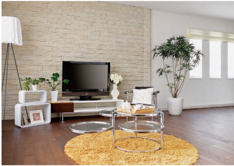
後半に入り、賑わいを見せている一方で、不安要因も浮上しています

春風吹く4月を迎え、年明け後の賃貸春の繁忙期も早や3カ月を過ぎようとしています。イラン情勢を受けて経済への影響を懸念する声が聞かれます。今後、原油価格や諸物価の高騰が果たして、賃貸経営にどのような影響を及ぼすのでしょうか。